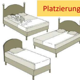
Platzierungsoptionen: Tuch / Matte